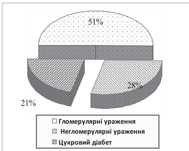
Рис.1. Характеристика пацієнтів за типом ураження нирок.

Питома вага померлих за типом ураження подано на рис. 1.