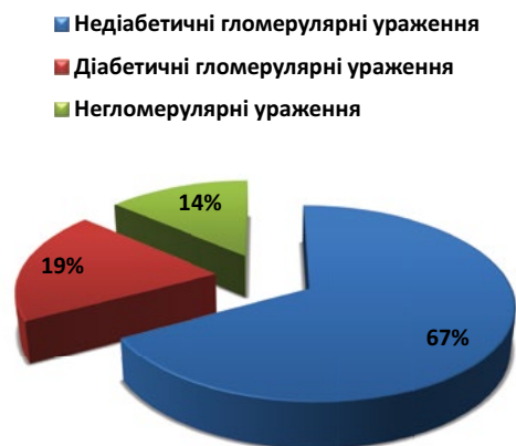
Рис. 1. Характеристика пацієнтів за типом ураження нирок

Матеріали та методи: До обсерваційного проспективного відкритого рандомізованого дослідження було включено 73 хворих на ХХН ВД ст. та коморбідну пневмонію з легким і середньотяжким перебігом, які отримували лікування ГД (59 хворих) та ПД (14 хворих) протягом 2013–2016 р.р. у Київському міському науково-практичному центрі нефрології та діалізу (КМНПЦН та Д), що є клінічною базою ДУ «Інститут нефрології НАМН України». Середній вік хворих склав 50,55 \pm 14,4 років, чоловіки становили 60,3% (44 хворих). За типом ураження нирок у досліджуваній популяції переважали хворі на недіабетичні гломерулярні ураження – 49 осіб (в тому числі 5 пацієнтів з гіпертензивною нефропатією), діабетичні гломерулярні та негломерулярні – 14 та 10, відповідно. Питома вага пацієнтів за типом ураження нирок подано на рис. 1.